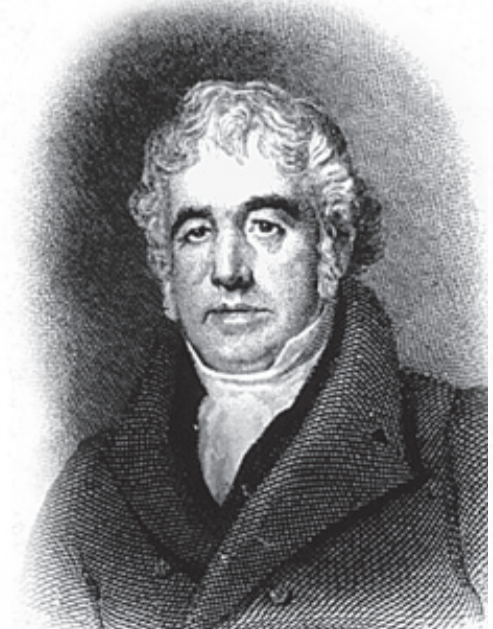
Portrét Charlese Macintoshe

...až budete spěchat do svého oblíbeného baru, před nepřízní počasí vás ochrání nepromokavý pláštěk do deště. Jeho anglický název Macintosh, zkráceně Mac, je pojmenovaný podle svého vynálezce. Tím je proslulý skotský chemik Charles Macintosh, který se roku 1766 narodil, jako mnoho dalších průmyslných Skotů, v také Glasgow. Ve zdejší katedrále je i pohřben. Již jako mladý se začal zajímat o využití moderních poznatků v chemickém průmyslu, proto závčas rezignoval na teplé místo úředníka. Při vymýšlení nových technologických procesů byl mnohem úspěšnější. Vynálezem, který ho ale skutečně proslavil byl speciální vodovzdorný materiál ze dvou bavlněných vrstev proložených gumou. Za své četné patenty byl roku 1823 zvolen členem Královské společnosti. Původně byl Macintoshem nazvem prestižní značky, později se tak začaly označovat všechny nepromokavé pláštěk.