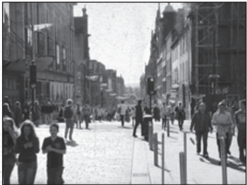
Buchanan Street, Glasgow

žádno? Žádná strhující panoramata nenabízí, zato zblízka je úžasná. Prvním vaším cílem necht je Glasgow Green - park u řeky Clyde, uprostřed kterého stojí muzeum People's Palace s rozkošnou zimní zahradou. Před muzeem můžete spatřit největší kaskádovitou fontánu na světě. Pouhou čtvrthodinku chůze odsud stojí jedno z nejdůležitějších poutních míst Evropy, Glasgow Cathedral s unikátní skotskou výzdobou a se zajímavým členěním prostoru. Nutností je navštívit West End, kde se nachází monumentální areál University of Glasgow. Na ni si rezervujte nejméně den, lépe ale dva. Součástí komplexu je velké muzeum Hunterian a super galerie výtvarného umění. Další turistickou lahůdkou je skvost secesního designu - dům manželů Mackintoshových. Tam určitě! Zcela utmácení rádi skončíte v botanické zahradě s nádhernými tropickými skleníky. Po cestě si smíte s rozumem svažit hrdlo kapkou whisky prakticky všude.