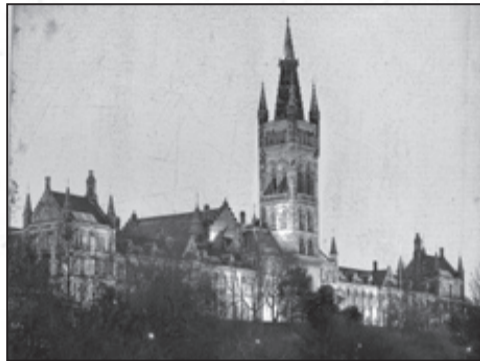
Univerzita s nápadnou věží.