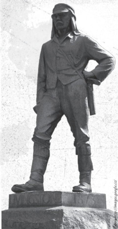
Socha Dr. Livingstonea