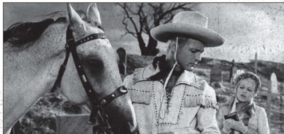
Foto z filmu - Limonádový Joe aneb Koňská opera...

nebo trvale žijících v ČR. Členem Klubu přátel Skotska se může stát každá fyzická osoba se zájmem o Skotsko, skotskou kulturu, historii i současnost a o příslušné aktivity v České republice a která je v případě zájmu ochotna podle svých možností napomáhat v činnosti Klubu přátel Skotska.